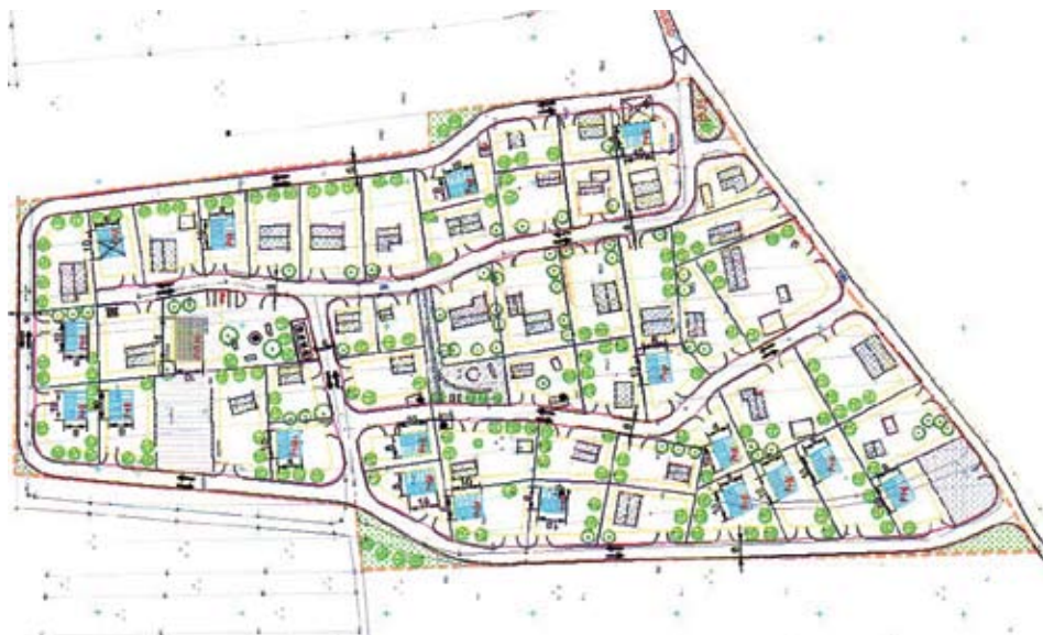
Vir: Romsko naselje Kerinov Grm, 2006, Krško

Že v začetku je treba opozoriti, da idealne lokacije romskih naselij ni; nastala so preveč stihijsko in se kasneje tako tudi širila ter spreminjala. Poleg splošnih pogojev, ki veljajo za vse posege v prostor, kot so na primer urejeno lastništvo, možnosti širitve, da ne ogrožajo vitalnih naravnih virov in tudi ne pomembne kulturne dediščine, da so prometno dostopne ipd.) je treba v primeru romskih naselij izpostaviti še nekatere specifične pogoje. Da bi Romi lahko dosegli čim uspešnejšo vključitev v družbo, potrebujejo vrsto specializiranih ustanov, ki so jim zmožna ponuditi strokovno pomoč. Gre predvsem za dostopnost do ustreznih izobraževalnih ustanov, zdravstvenih služb, centrov za socialno delo, poklicno usposabljanje in izobraževanje (tudi odraslih!). Posebej v zadnjih letih se je pokazal tudi izjemen pomen varnostnega segmenta in preventivnega dela policije. Bližina teh služb in za to kvalificiranih oseb je bistveno pripomogla k uspešnejši integraciji in zmanjševanju konfliktov, ne more pa jih povsem odpraviti.