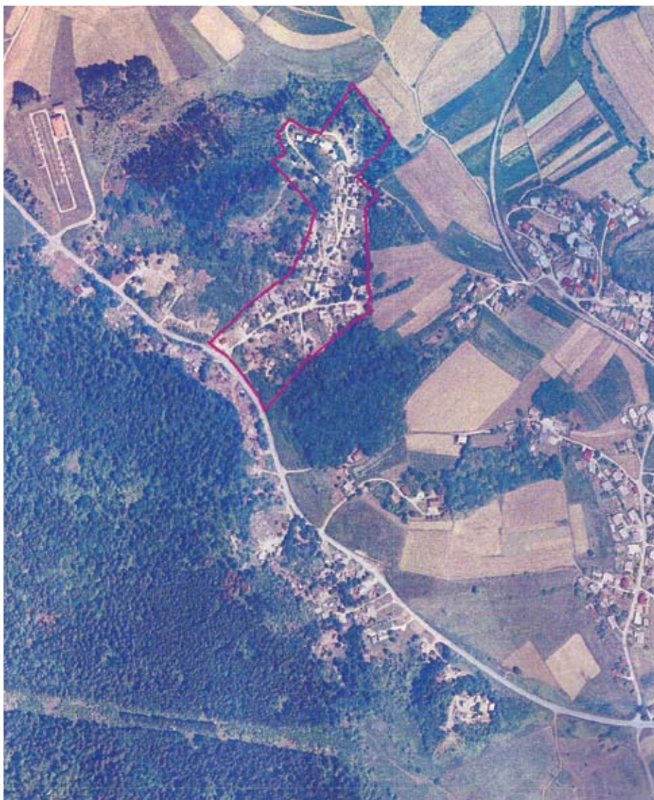
Figure 2: The figure shows one of the largest Roma settlements in Slovenia: Brezje and Žabjak near Novo mesto (Dolenjsko region). The area marked with red is the part of settlement of Brezje, planned for communal reconstruction