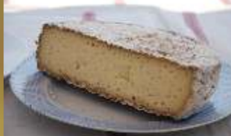
Sir iz Goričkega