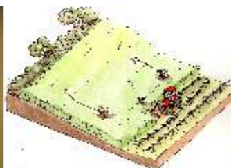
Živalim prijazen način košnje