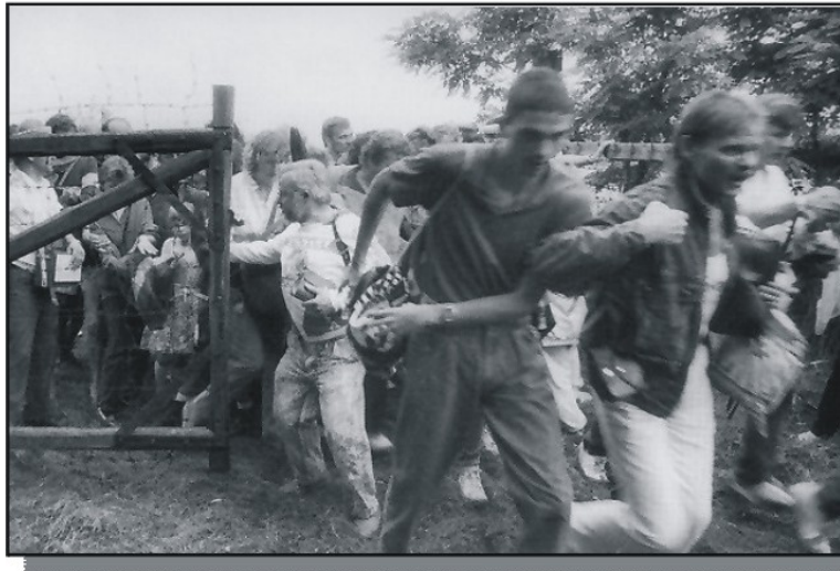
19. Avgust 1989 - Pan evropski piknik v Sarodu