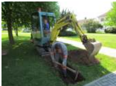
Izvedba premika vodnjaka

Iz tega razloga postavitev zgornje konstrukcije na tej lokaciji ni bila mogoča. Tako se je izvedel premik na »otok« med cerkvijo ter avtobusnim postajališčem. Narejen je bil preboj pod cesto in nameščena cev v dolžini 15 m, ki omogoča črpanje vode iz vodnjaka v vgrajen bazen na »otoku«.