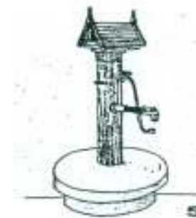
Skica vodnjaka na železno črpalko

pasje glave. Na vrh oboda je bila pritrjena majhna lesena lepo izrezljana streha s kovinskimi okraski na konicah. Na zunanji obod vodnjaka je bila navadno položena cementna plošča. V spomin na nekdanji vaški studenec Občina Cankova še vedno hrani železno cev.