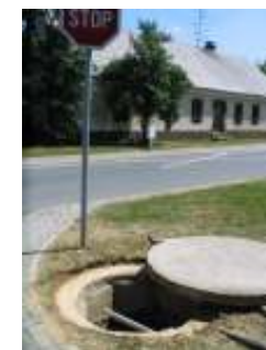
Izvorni vodnjak danes

Sam vodnjak je danes na podlagi nove zasnove parka in ureditve avtobusnega postajališča lociran tik ob priključku na regionalno cesto ob prometnem znaku.