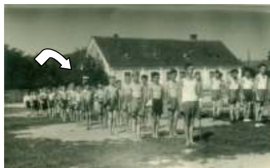
TVD Partizan leta 1954 – v ozadju viden vodnjak na črpalko

Kasneje (prva polovica 20. stol.) se na Cankovi omenja vodnjak na železno črpalko ali »stüdenec s pumpov«, ki ga zasledimo tudi na fotografijah iz šestdesetih let prejšnjega stoletja. Kmalu zatem se je zgornji del vodnjaka podrl.