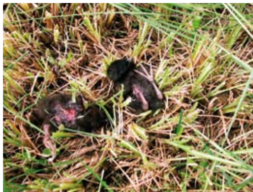
Posledice prezgodnje košnje

Po eni strani kosca ogroža zaraščanje zaradi opuščanja kmetijske rabe, po drugi strani pa resno grožnjo predstavlja intenzivna raba (prezgodnja košnja, neustrezno gnojenje). Košnja, ki se izvaja v času, ko mladiči še niso sposobni zapustiti gnezda, uniči več kot 1/2 vseh mladičev.