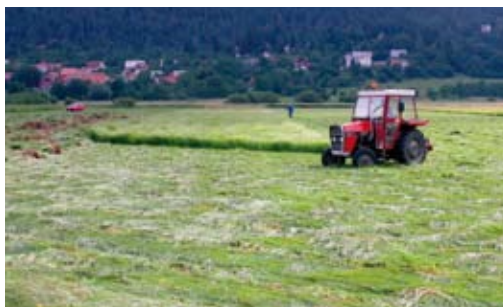
Nepravilna košnja, iz zunanjih robov prosti sredini

Po eni strani so travniške ptice in metulje ogroža zaraščanje travnikov zaradi opuščanja kmetijske rabe, po drugi strani pa resno grožnjo predstavlja intenzivno gospodarjenje s travniki (prezgodnja košnja, neustrezno gnojenje).