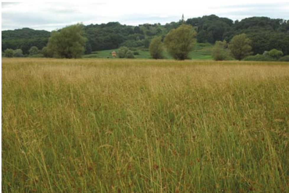
Trava pozno košenih travnikov se uporablja za steljo

Ministrstvo za kmetijstvo, gozdarstvo in prehrano podpira prizadevanja za ohranitev kosca v Sloveniji. Podukrep STE 214-III/4 Ohranjanje steljnikov je namenjen vzpodbujanju izvajanja prilagojene kmetijske prakse, ki poleg pridelave krme skrbi tudi za prijazen življenjski prostor kosca in metuljev.