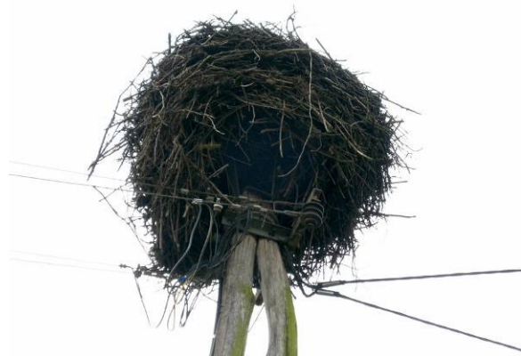
Foto 1: Stanje gnezda 7.04.2009