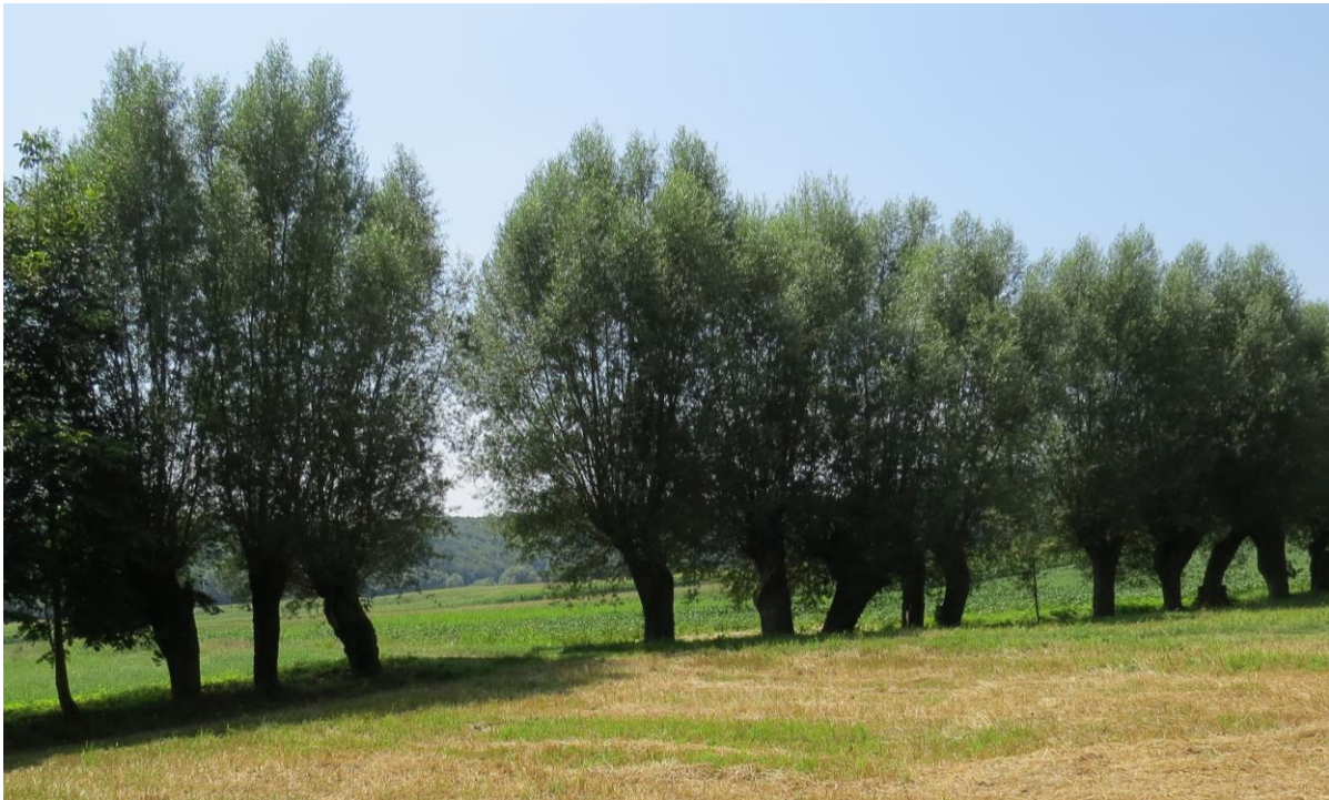
Slika 6: Primer mejice starih glavatih vrb iz okolice Rogaševcev. Večina dreves v tej mejici je primerna za pogodbeno varstvo za namene ohranjanja puščavnika.