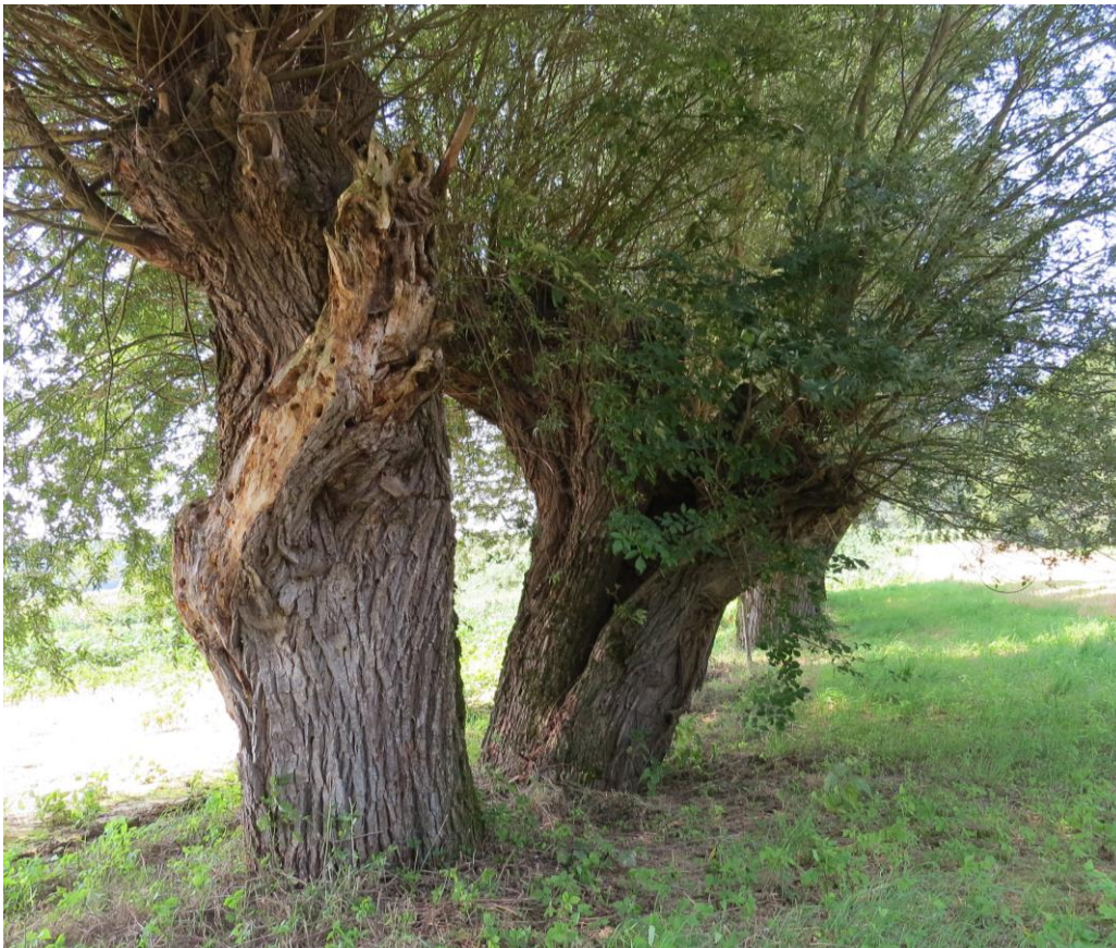
Slika 4: Primer vrbe ( Salix ) primerne za pogodbeno varstvo za namene ohranjanja puščavnika na območju Natura 2000 Goričko.