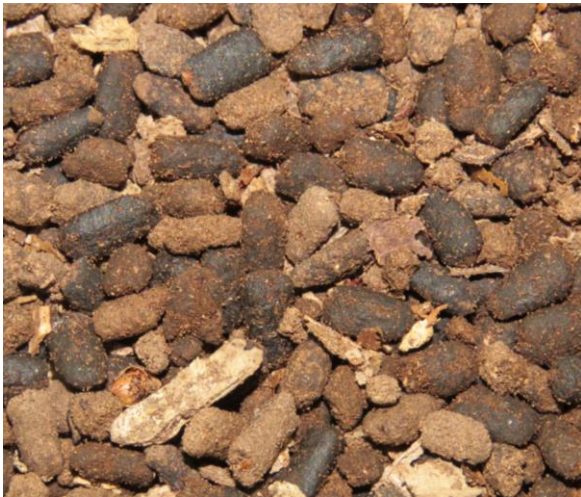
Slika 2: Iztrebki ličink puščavnika ( Osmoderma eremita complex ), ki se ohranijo v drevesnem mulju in imajo značilno ploščato obliko.

Prisotnost puščavnika smo preverjali po metodi pregledovanja lesnega mulja (VREZEC S SOD. 2008) in sicer le pri drevesih z dostopno odprtino drevesnega dupla. Pri pregledu mulja smo beležili prisotnost iztrebkov (slika 2), ličink (slika 3) ali ostanke odraslih hroščev.