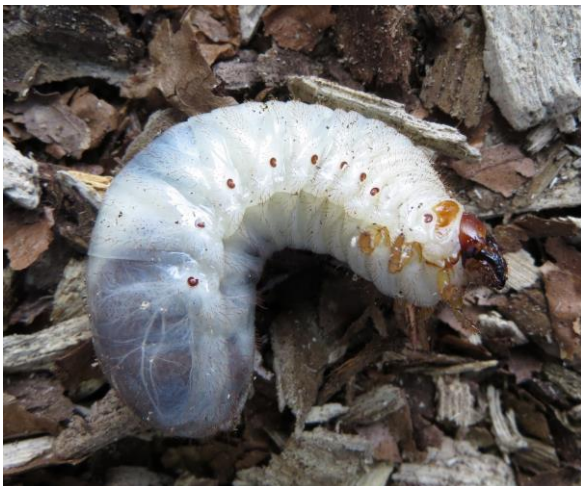
Slika 3: Ličinka puščavnika ( Osmoderma eremita complex ).