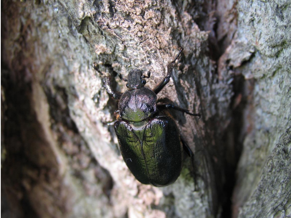
Slika 1: Populacija puščavnika na območju Natura 2000 Goričko na bi pripadala vzhodni vrsti Osmoderma barnabita ; na sliki je prvi najdeni primerek na Goričkem iz Serdice fotografiran dne 10.7.2006.

Namen pričujoče naloge je bil popis glavatih in drugih vrb na območju Natura 2000 Goričko glede na primernost kot habitat puščavnika. Ob tem smo opredelili kvaliteto dreves s stališča ohranjanja puščavnika, pregledali nekatera dupla za preverjanje prisotnosti vrste in določili drevesa za sklepanje pogodbenega varstva. Naloga je nastala v okviru pogodbe št. 3.23-EN12/2018-LG projekta Gorička krajina (projekt je sofinanciran v okviru Operativnega programa za izvajanje Evropske kohezijske politike za obdobje izvajanja 2014-2020. Naložbo sofinancirata Republika Slovenija in Evropska unija iz Evropskega sklada za regionalni razvoj).