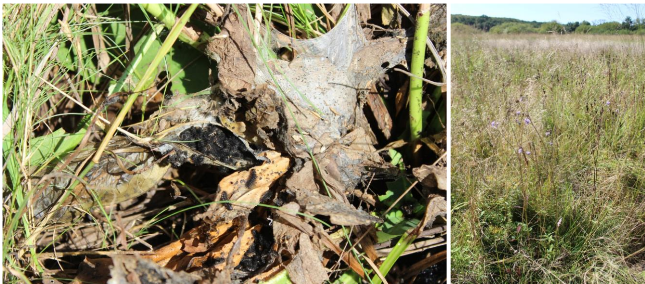
Slika 4: Gnezdo gosenic travniškega postavneža ( Euphydryas aurinia) (levo) na hranilni rastlini gosenic travniški izjevki ( Succisa pratensis) (desno).