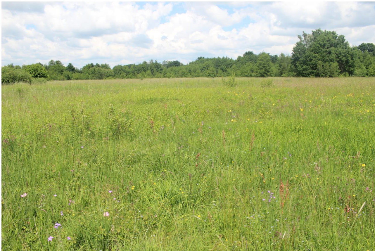
Slika 3: Ekstenzivno gojen vlažen travnik, habitat travniškega postavneža ( Euphydryas aurinia), na območju naravne vrednote Motvarjevci.