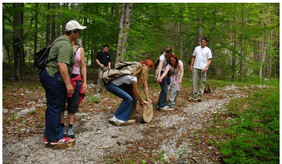
Doživljajske igre v Krajinskem parku Logarska dolina

Na Solčavskem si prizadevamo za naravi in obiskovalcem prijazen ter domačinom koristen razvoj turizma ■