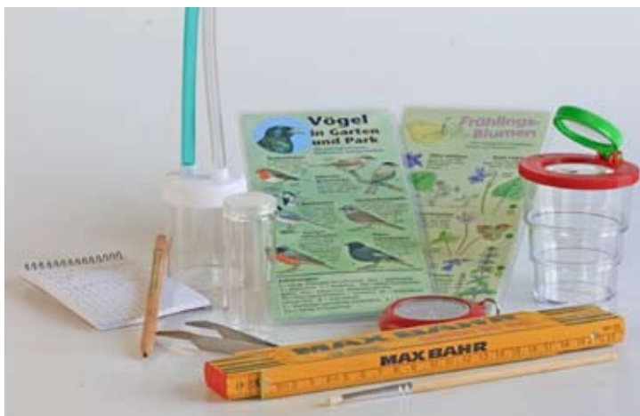
Pripomočki za raziskovanje v naravi

V skladu s tem motom ponujajo raziskovalni jopiči otrokom in mladostnikom možnost razvoja individualnega razumevanja narave in bodo postali del izobraževanja v naravi v naravnih parkih po celotni Nemčiji ■