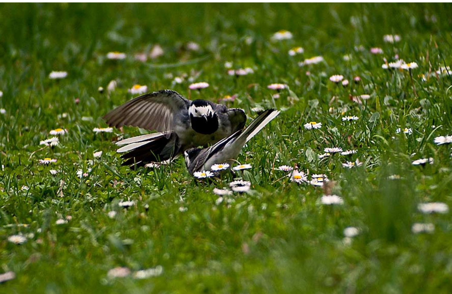
Dvoboj dveh pastirc

Kakšne jopiče za raziskovalce narave so si zamislili v Nemčiji, kakšen zločin so zakrivali nemarni škornji in kaj si mislijo o nas Finci, preberite v nadaljevanju ■