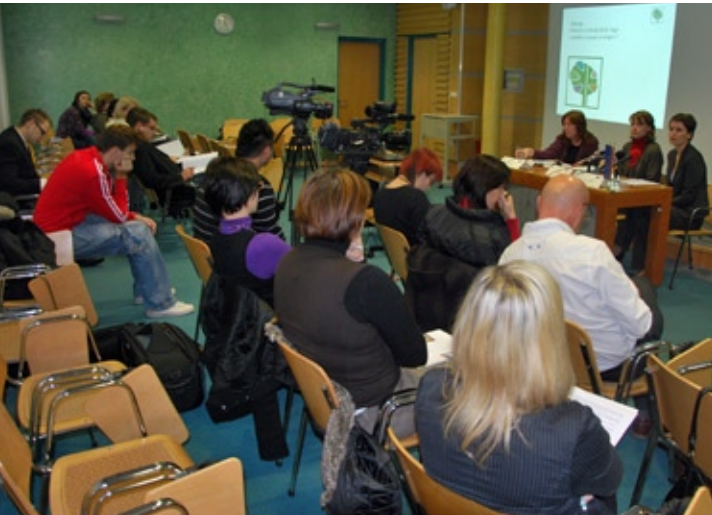
Udeleženci novinarske konference

Udeležencem konference so odgovarjale na vprašanja, ki so se nanašala na vidne rezultate projekta, razlike med vodenjem v naravi in krajini za običajne obiskovalce in osebe s posebnimi potrebami ter o nadaljnjih korakih pri vzpostavitvi certificiranega usposabljanja vodnikov v naravi in krajini. Predstavitev interpretacije narave in krajine je potekala interaktivno, navzoči so interpretirali logotip projekta.